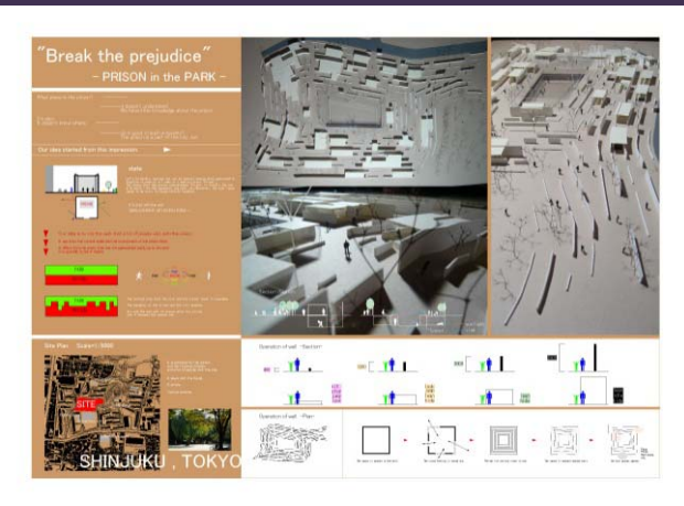
Socio design's 2009 国際学生建築コンペ(入選)