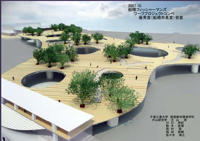
船橋フィッシャーメンズ・ワーフプロジェクト(優秀賞)