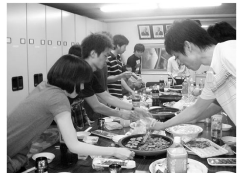
研究室に配属された3年生の歓迎会