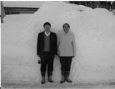
チェン先生とテイ先生、2人の吉林大学教授が客員研究員として 滞在。外国の方はみんな日本の積雪に驚きます