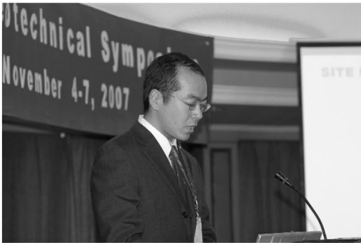
T君(博士1年)の国際会議 英語発表(三峽)