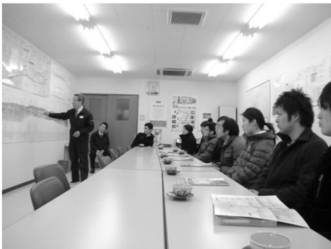
東京メトロ副都心線工事現場見学