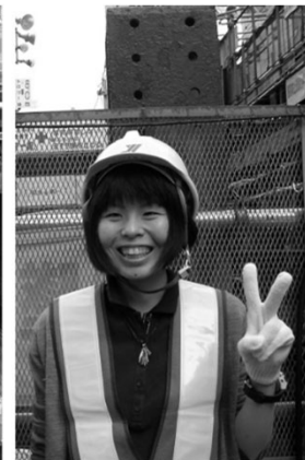
JR超近接アンダーパストネル工事現場計測