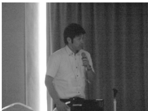
S君(修士2年)の学会発表(広島)