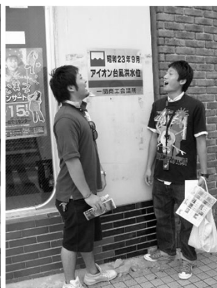
Iさん(修士1年)の学会発表(仙台)と発表後のツアー