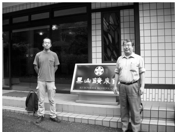
黒山鉱泉で研究合宿