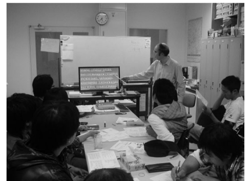
毎週ファン教授の中国語講座