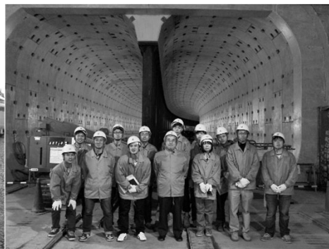
東急東横線渋谷～代官山間 シールドトンネル工事視察