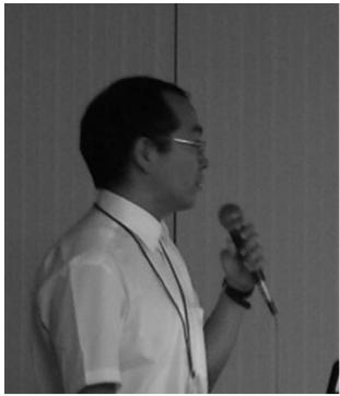
T君(博士3年)の 学会発表(神戸)