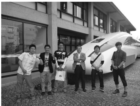
研究打合せを終えた4年生 (鉄道総合技術研究所)