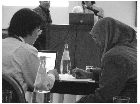
発表後にはいつもディスカッション の申込があります(ポルトガル)