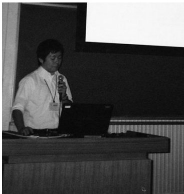
U君(修士2年)の学会発表 (松山)