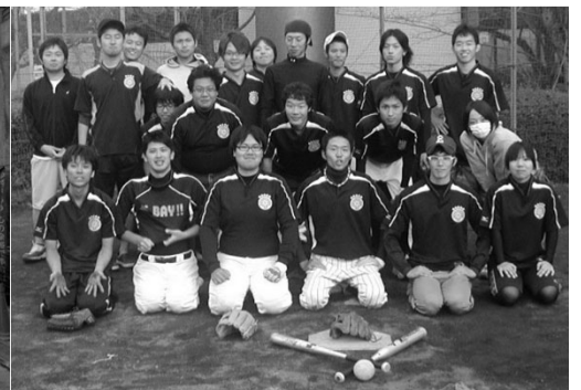
関東大学土質研対抗 ソフトボール大会