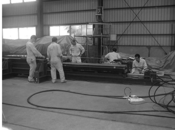
JRとの大型実験に取り組む4年生(山梨)