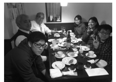
卒論合格祝賀ディナー