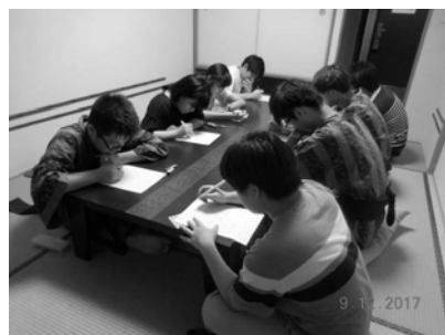
夏合宿地盤工学マッチ(箱根)