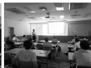
N氏の国際会議発表(インスブルック)と博士論文公聴会