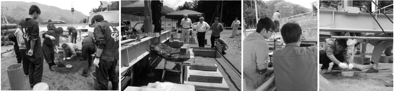
半年間かけて山梨県大月市で原位置大規模実験を実施