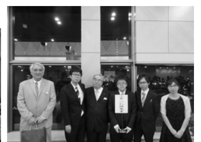
今年度も頑張りました