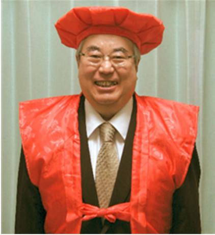
還暦を迎えました。

～新型コロナ禍が続く中、年が明けるとウクライナ問題も発生しました。世界が混沌としています～