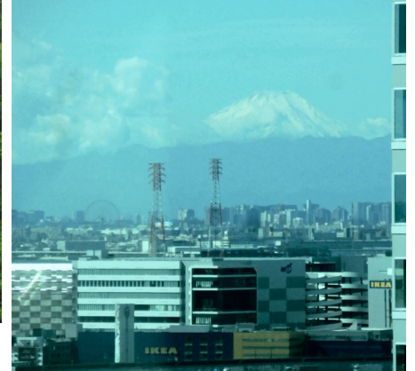
隣に超高層マンションが建ちましたが、研究室から富士山がまだ見えることを発見。