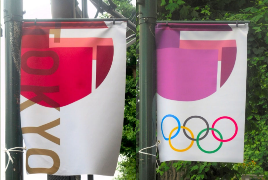
1年遅れで東京オリンピック・パラリンピックが開催されました。