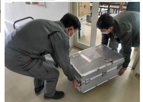
研究の手は緩めません。でも実験室がなくなったので借りていた電子顕微鏡はお返ししました。