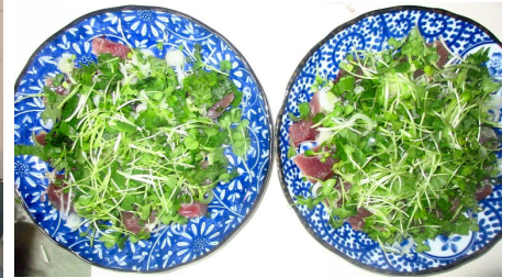
今年も鰹は自宅でさばきました。